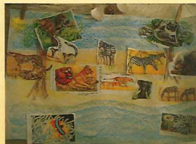
Wo leben die Tiere?